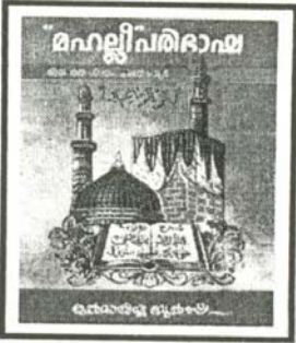
(മഹല്ലി പരി ഭാഷ: 1/155,156)

വളവിൽ ഓരോഅവയവങ്ങളും കഴുകുമ്പോൾ പ്രത്യേകം ചൊല്ലാനായി 'മുഹർററി'ൽ പറഞ്ഞ പ്രാർത്ഥനകൾ ഇവിടെ നിന്നൊഴുവാക്കുകയാണ്. കാരണം അടിസ്ഥാനരഹിതമാണു അവ.