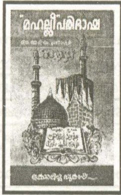
(മഹല്ലി പരിഭാഷ, 1/403)

നമസ്കരിക്കുമ്പോൾ പലരും പല സ്ഥലങ്ങളിലും കൈ കെട്ടാറുണ്ട്. എന്നാൽ നബി(സ) കൈ കെട്ടിയത് നെബിന്ദേൽ മാത്രമാണെന്ന് ഹദീസുകൾ പഠിപ്പിക്കുന്നു. മഹല്ലി തന്നെ അത്തരത്തിലുള്ള ഒരു റിപ്പോർട്ട് ഉദ്ധരിക്കുന്നത് കാണുക: